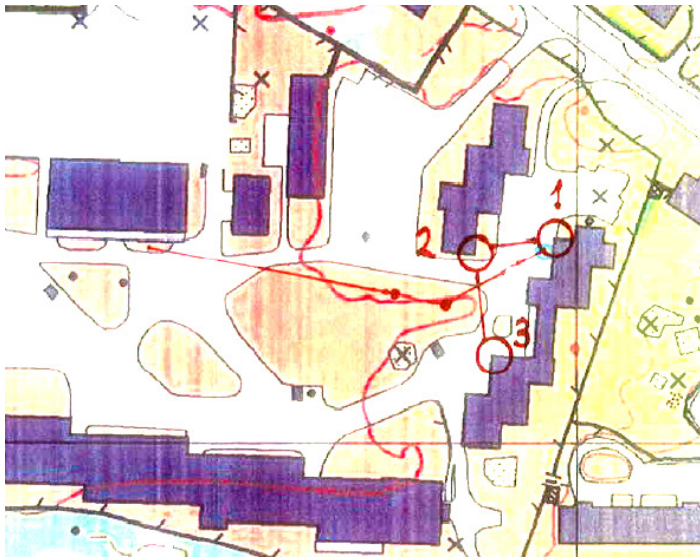
Eksempel: Løype 10